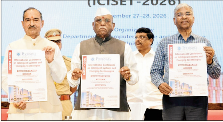
जयपुर. शाबाश इंडिया

भारत की प्राचीन शिक्षा प्रणाली मुख्य रूप से वैदिक परंपरा थी