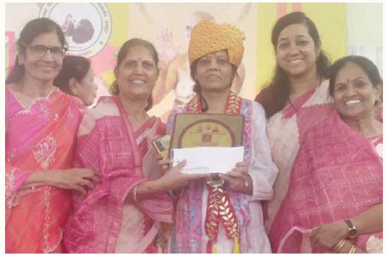
जयपुर. शाबाश इंडिया

श्री दिगंबर जैन महिला महासमिति एवं श्रमण संस्थान के सानिध्य में आयोजित 10 दिवसीय तत्वज्ञान शिविर का समापन समारोह 31 मई को दुगापुरा जैन मंदिर में आयोजित किया गया। समारोह के दौरान शिविर में उत्कृष्ट प्रदर्शन करने वाले विद्यार्थियों का सम्मान एवं पारितोषिक वितरण किया गया।