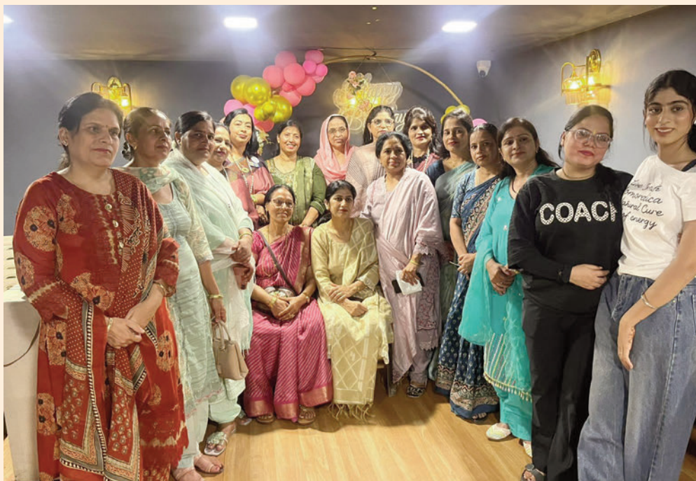
ऐलनाबाद. शाबाश इंडिया

अंतरराष्ट्रीय सामाजिक संस्था एपेक्स क्लब की महिला इकाई के रूप में ऐलनाबाद में एपेक्स वूमैन क्लब की स्थापना की गई।