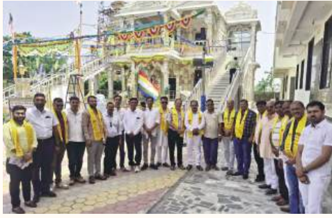
अपने विचार साझा करते हुए संगठन को और अधिक सक्रिय