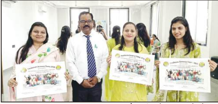
ब्यावर. शाबाश इंडिया