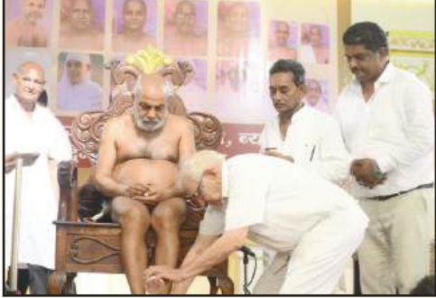
पुण्य के प्रभाव से होता है चातुर्मास, धर्म एवं चरित्र ही जीवन को बनाते हैं सार्थक