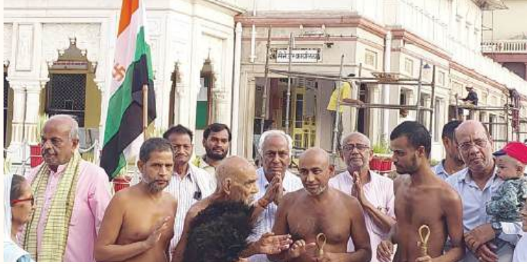
श्री महावीरजी.