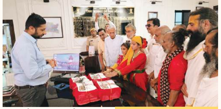
भीलवाड़ा. शाबाश इंडिया