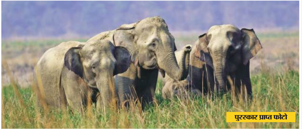
पुरस्कार प्राप्त फोटो