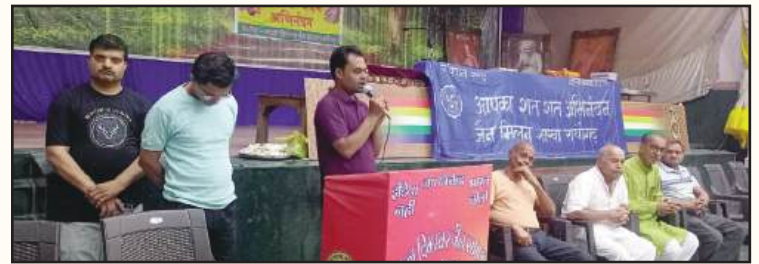
राधोगढ़. शाबाश इंडिया