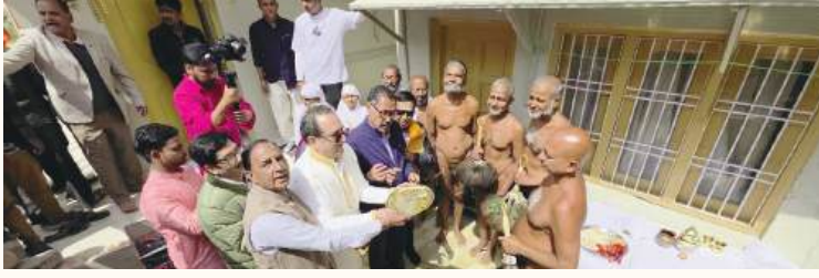
बद्रीनाथ.