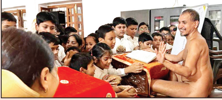
झुमरी तिलैया, कोडरमा, शाबाश इंडिया