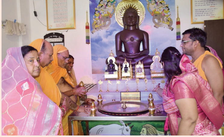
गुंसी, निवाई. शाबाश इंडिया