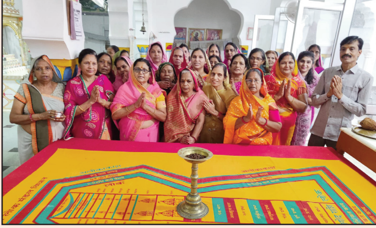
श्रद्धालुओं ने 2100 अर्घ्य चढ़ाए