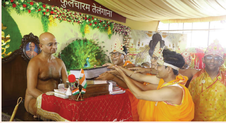
कुलचाराम, हैदराबाद. शाबाश इंडिया

तेलंगाना के प्रियाग्र अतिशय क्षेत्र कुलचाराम पारसनाथ एवं अन्तर्मना साधना महोदधि आचार्य चतुर्विध संघ के मणिकांचन संयोग पर विश्व इतिहास में प्रथम बार दस दिवसीय अखंड जिनसहस्रनाम पाठ, भगवत जिनेन्द्र महाअर्चना एवं मंत्रानुष्ठान महोत्सव हो रहा है। 03 से 13 अक्टूबर, 2024 उत्कृष्टसिंह निष्क्रीडित व्रत कर्ता, साधना महोदधि, उभय मासोपवासी अन्तर्मना