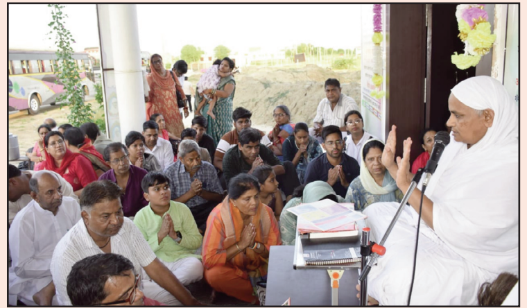
गुंसी, निवाई. शाबाश इंडिया