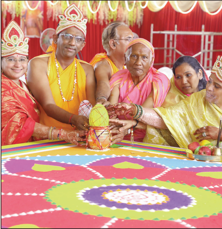
कुलचाराम, हैदराबाद. शाबाश इंडिया