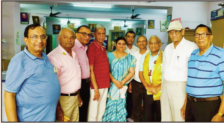
जयपुर. शाबाश इंडिया

श्री महावीर दिगंबर जैन बालिका उच्च माध्यमिक विद्यालय, चौड़ा रास्ता, जयपुर में 487 विद्यार्थियों का निःशुल्क नेत्र परिक्षण किया गया। जिसमें से 88 विद्यार्थियों की नजर कमजोर पाई गई। उक्त 88 विद्यार्थियों को शीघ्र