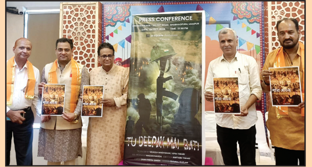
उदयपुर, शाबाश इंडिया

उदयपुर से प्रोड्यूस होने वाली पहली राजस्थानी फिल्म- "तू दीया मैं बाती" का पोस्टर विमोचन