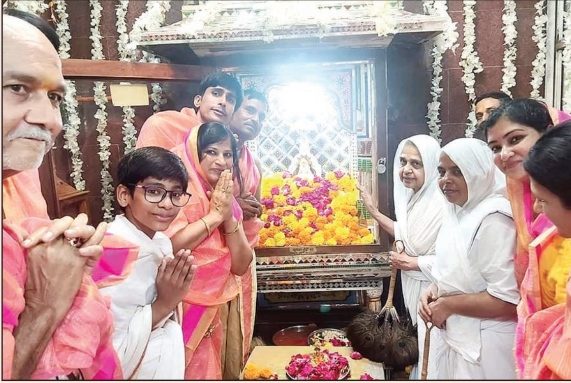
रामगंजमंडी. शाबाश इंडिया