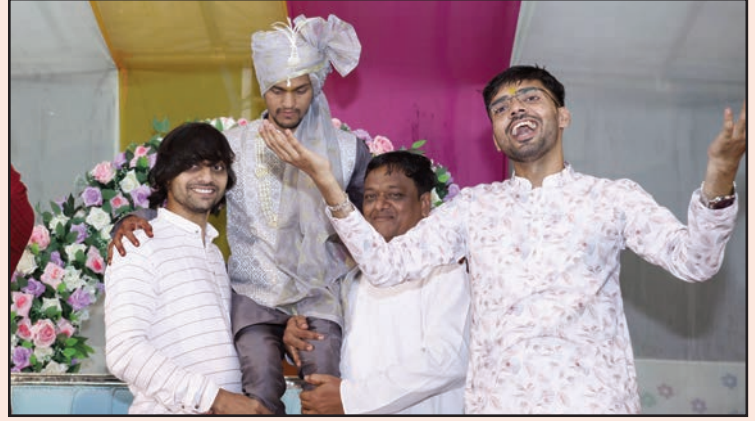
सागर. शाबाश इंडिया