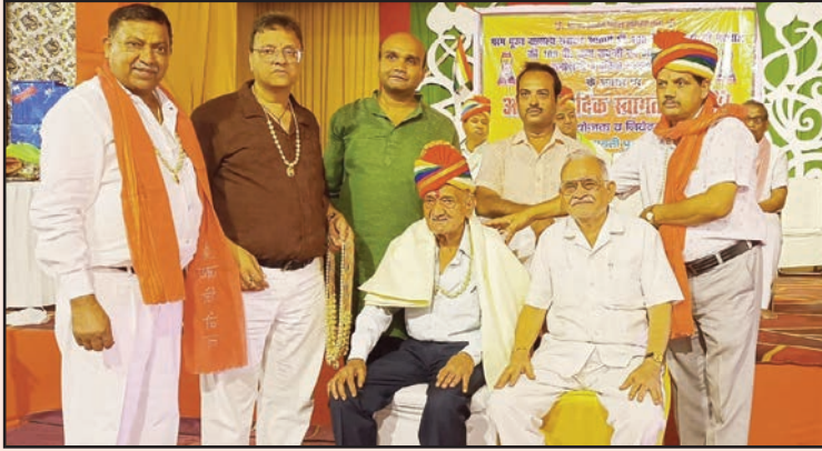
आगरा. शाबाश इंडिया