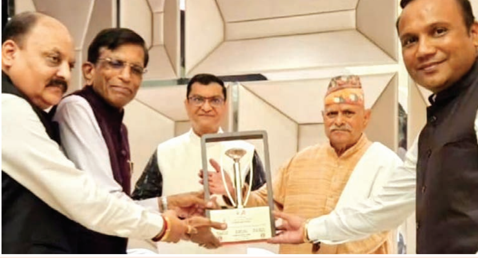
सूरत. शाबाश इंडिया