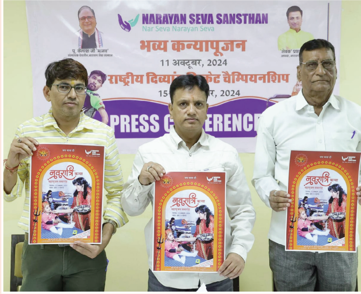
उदयपुर. शाबाश इंडिया