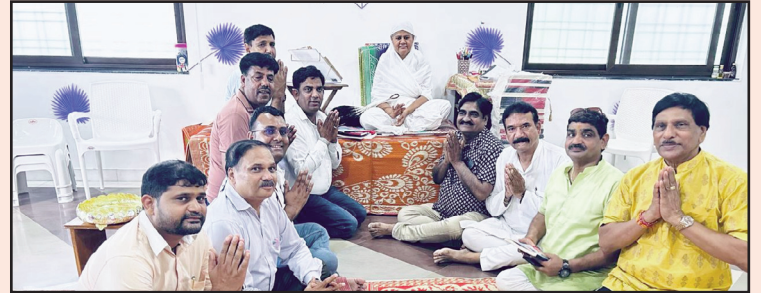
जयपुर. शाबाश इंडिया