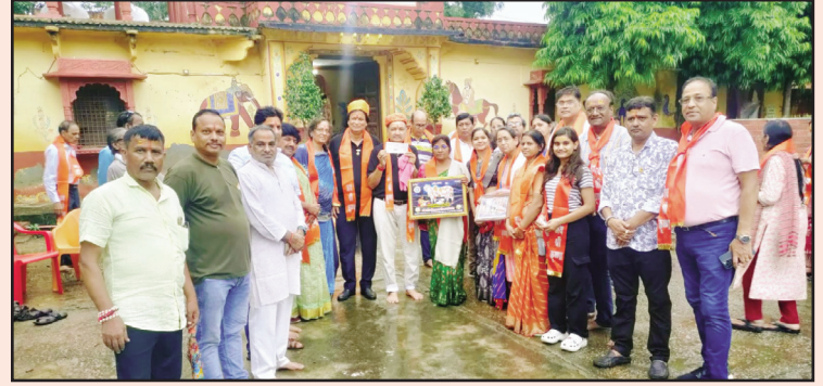
आजाद शेरवानी, शाबाश इंडिया