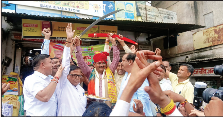
फागी. शाबाश इंडिया