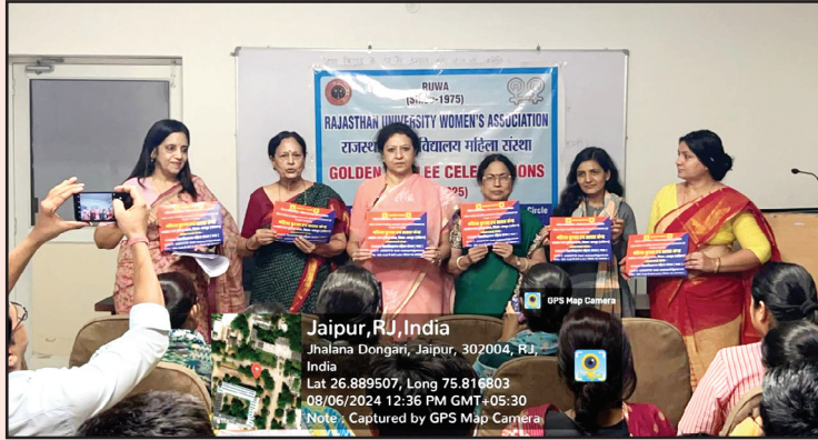
Jaipur, RJ, India Jhalana Dongari, Jaipur, 302004, RJ, India Lat 26.889507, Long 75.816803 08/06/2024 12:36 PM GMT+05:30 Note: Captured by GPS Map Camera