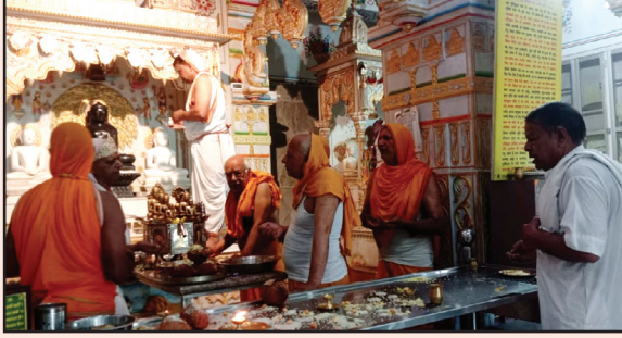
फागी. शाबाश इंडिया