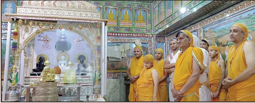
जयपुर. शाबाश इंडिया

आज से 35 वर्ष पूर्व कृष्ण जन्माष्टमी के दिन श्री महावीर दिगंबर जैन मंदिर मुरलीपुरा जयपुर की स्थापना हुई थी। कृष्ण जन्माष्टमी के साथ ही इस दिन को प्रति वर्ष मुरलीपुरा जैन समाज स्थापना दिवस के रूप में धूमधाम के साथ मनाता आ रहा है। इसी कड़ी में दिनांक 26