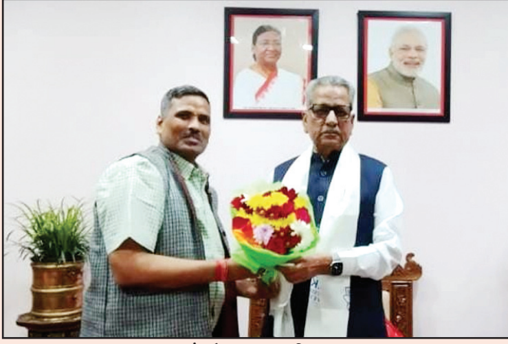
गैंगटोक, शाबाश इंडिया