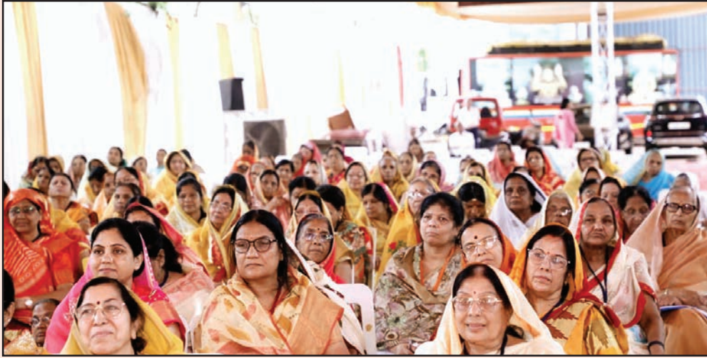
हैदराबाद. शाबाश इंडिया