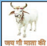
जय गौ माता की