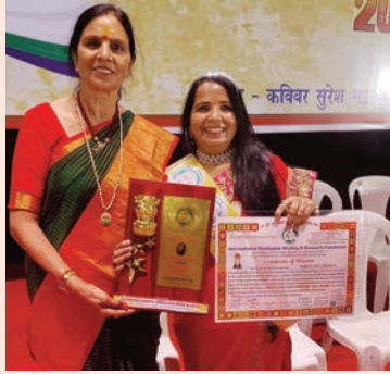
नागपुर. शाबाश इंडिया