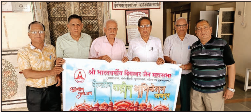
जयपुर. शाबाश इंडिया

जैन समाज के लिए हर्ष का विषय है कि इस वर्ष समाज के विकास एवं कल्याण के लिए कृतसंकल्प 130 वर्ष पुरानी