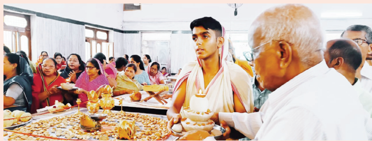
आगरा. शाबाश इंडिया