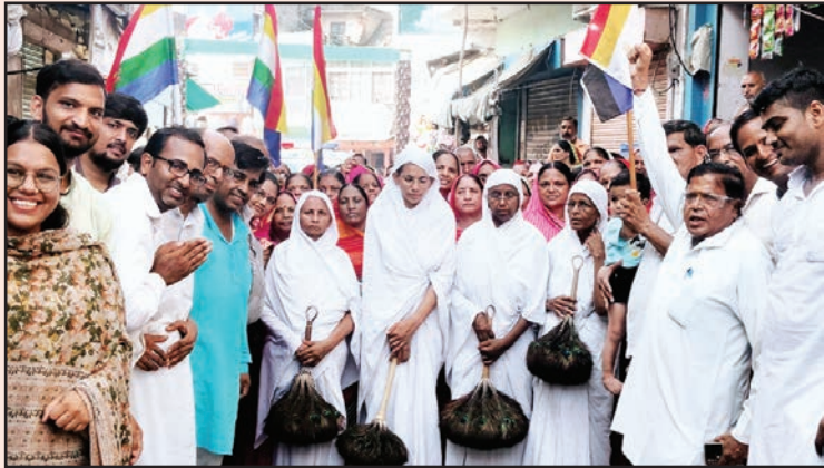
फागी, शाबाश इंडिया