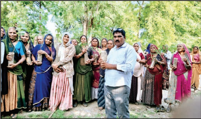
चित्तौड़गढ़, शाबाश इंडिया