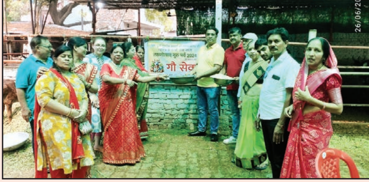
आगरा. शाबाश इंडिया