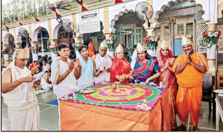
रामगंजमंडी. शाबाश इंडिया