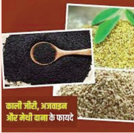
काली जीरी, अजवाइन और मेथी दाना के फायदे

मेथी, अजवाइन और काली जीरी पाउडर का सेवन करने से कई फायदे हो सकते हैं। ये सभी मसाले आयुर्वेदिक और स्वास्थ्य संबंधित लाभों के लिए प्रसिद्ध हैं।