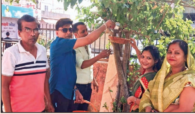
जयपुर. शाबाश इंडिया

राजस्थान जैन युवा महासभा जयपुर, जो कि गत 30 वर्षों से जैन युवा एवं महिला संगठनों की प्रदेश स्तरीय