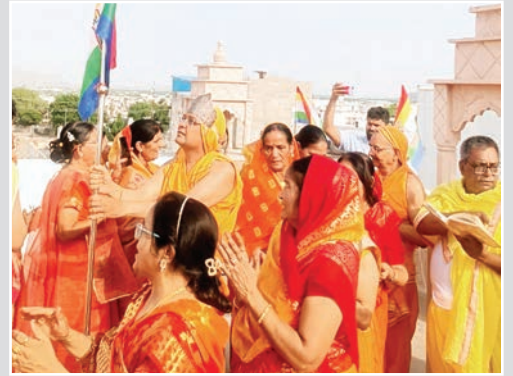
ब्यावर. शाबाश इंडिया