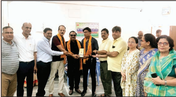
जयपुर, शाबाश इंडिया