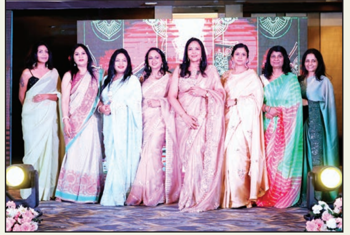
जयपुर. शाबाश इंडिया