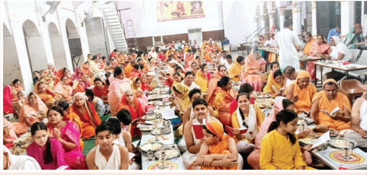
रामगंजमंडी, शाबाश इंडिया