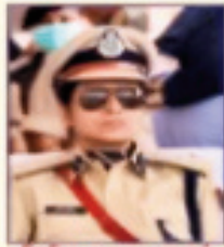
शिविर उद्घाटनकर्ता PREETI CHANDRA IPS AA of CP - District & Sessions Judge/Judge Jaipur Court Building Jaipur