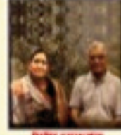
संयोजक श्रीमती अशोक सहसंयोजक/सहसंयोजक श्रीमती अशोक