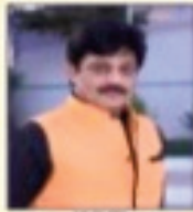
संयोजक श्रीमती अशोक सहसंयोजक/सहसंयोजक श्रीमती अशोक