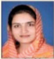
संयोजक/सहसंयोजक श्रीमती अशोक सहसंयोजक/सहसंयोजक श्रीमती अशोक

रक्तदान शिविर:- दिगम्बर जैन सोशल ग्रुप फेडरेशन राजस्थान रीजन जयपुर एवं दिगम्बर जैन सोशल ग्रुप सन्मति, जयपुर के संयुक्त तत्वावधान में