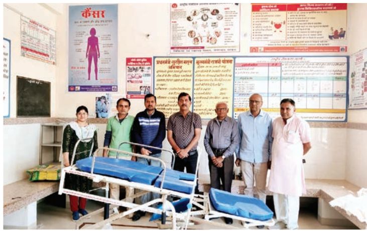
सुजानगढ़.