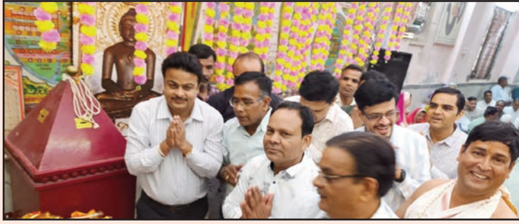
व्यारह किलो का लड्डू चढ़ाया, श्रद्धालुओं के जयकारों से गूंजा मंदिर परिसर