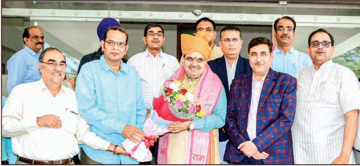
जयपुर. शाबाश इंडिया

पेट्रोल, डीजल पर राजस्थान में "एक राज्य, एक कीमत" प्रभावी होने को बताया ऐतिहासिक, वैट दरों में कमी से मिलेगी सभी प्रदेशवासियों को राहत