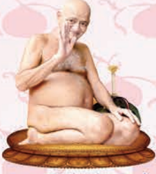
सन्त शिरोमणी आचार्य 108 श्री विद्यासागर जी महाराज