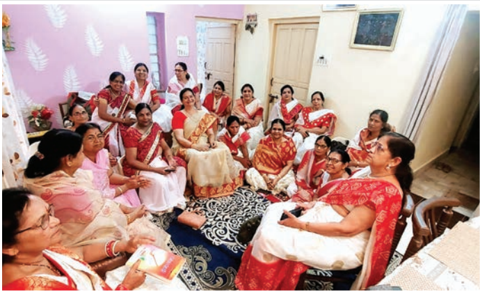
अजमेर. शाबाश इंडिया