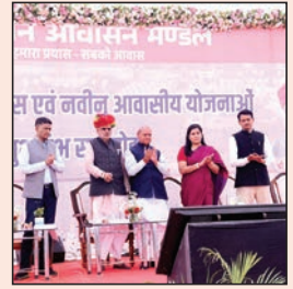
जयपुर. शाबाश इंडिया

मील का पत्थर साबित हो रही हैं आवासन मंडल की परियोजनाएं: खर्मा