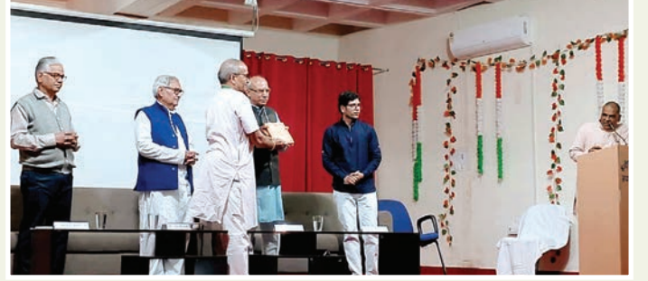
जयपुर. शाबाश इंडिया