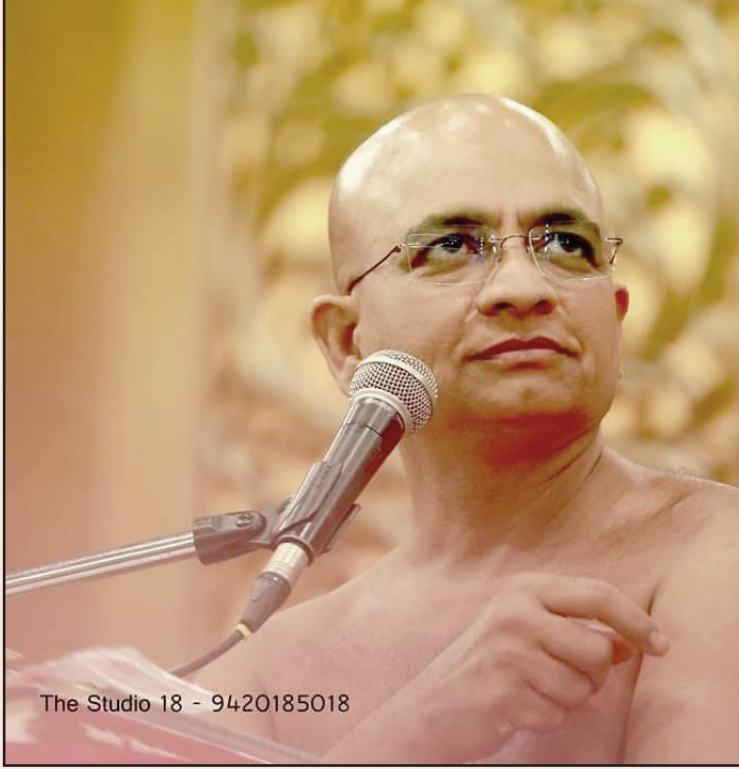
The Studio 18 - 9420185018

स्वार्थ का प्रभाव अक्सर जीवन को स्वभाव में ले आता है..!