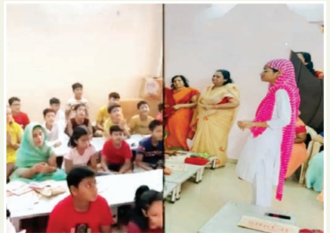
जयपुर. शाबाश इंडिया