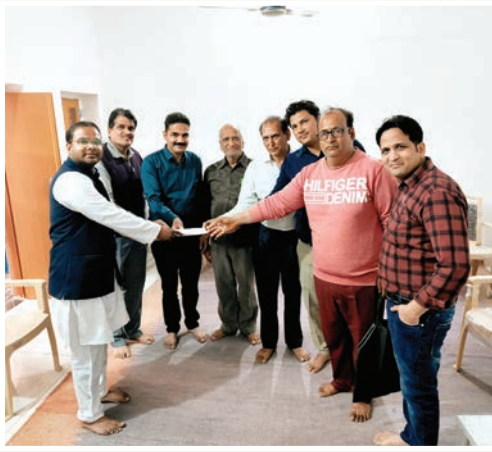
सीकर. शाबाश इंडिया