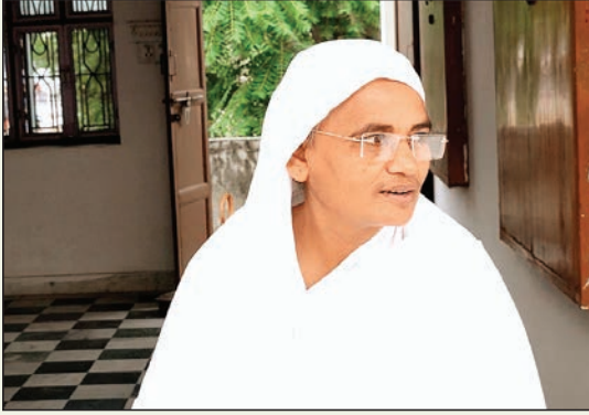
गुंसी, निवाई, शाबाश इंडिया