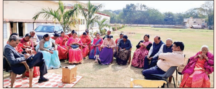
जयपुर.