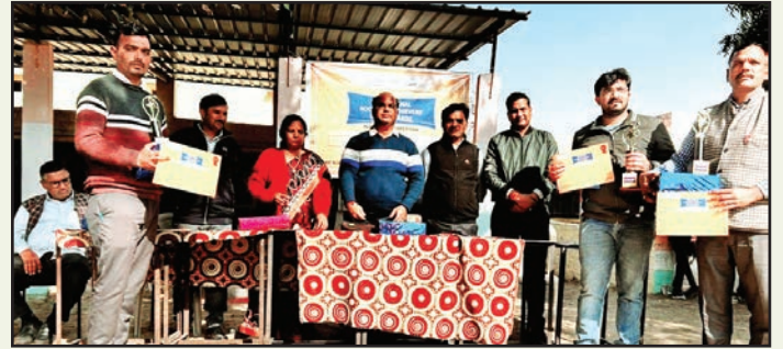
बालेसर. शाबाश इंडिया