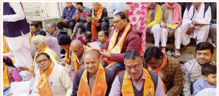
फागी. शाबाश इंडिया