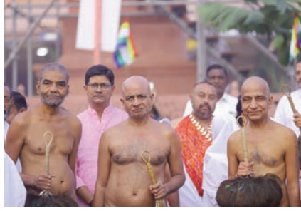
औरंगाबाद, शाबाश इंडिया