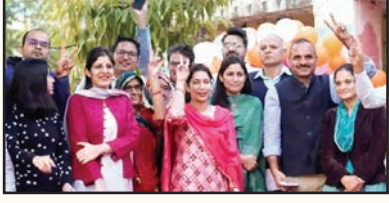
चौमूं शाबाश इंडिया

लोकतंत्र के महापर्व पर शनिवार सुबह 7 से लेकर देर शाम करीब 7: 30 बजे मतदान प्रक्रिया समाप्त हुई। चौमूं विधानसभा क्षेत्र में 83.67% प्रतिशत मतदान हुआ। उपखंड इलाके में 228 मतदान केंद्र बनाए गए थे। प्रत्याशियों के भाग्य का फैसला अब ईवीएम मशीन में बंद हो चुका है और आगामी 3 दिसंबर को जब परिणाम आएंगे तब पता चलेगा कि चौमूं का ताज किसके सिर पर होगा। मतदान प्रक्रिया समाप्त होने के बाद सभी मतदान दलों की टीमों की ईवीएम मशीनों को सील करके जयपुर के लिए रवाना किया गया। वोटिंग को लेकर युवा और महिला मतदाताओं में भी काफी उत्साह का माहौल नजर आया। सुबह 11 बजे तक 25.39 फीसदी मतदान हुआ। वहीं, शहर के रेलवे स्टेशन रोड स्थित मतदान केंद्रों नंबर 93 पर करीब 10 मिनट के लिए ईवीएम मशीन टेक्निकल खामी के चलते बंद हो गई।