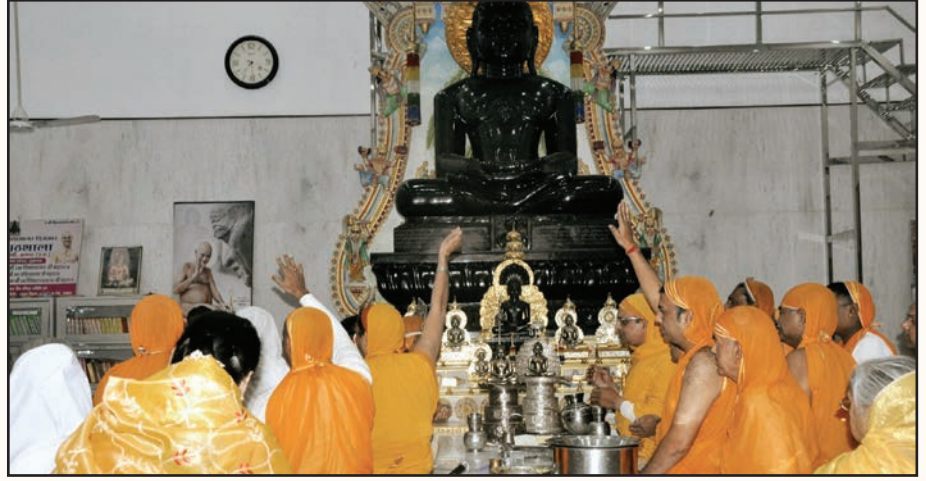
आगरा. शाबाश इंडिया