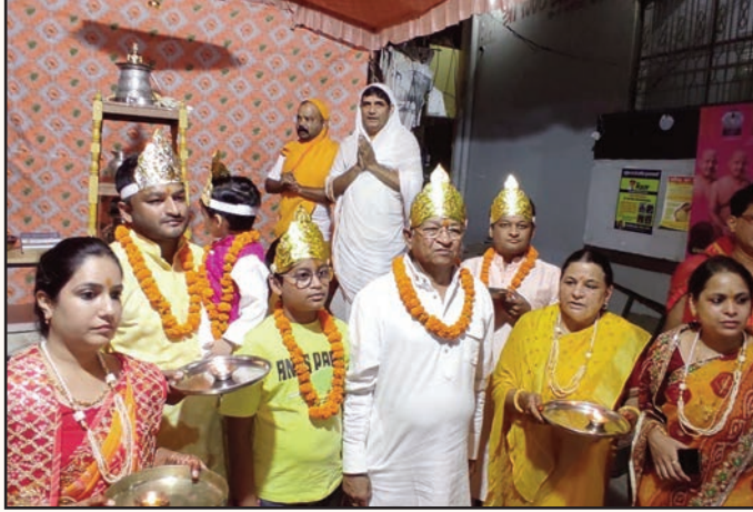
जयपुर. शाबाश इंडिया

दस लक्षण धर्म समारोह श्री शांतिनाथ दि.जैन मंदिर 10 बी स्कीम में जैन धर्मावलंबियों का 10 दिन तक चलने वाला आत्म शोधन का शाश्वत पर्व का 28 सितंबर को समापन