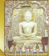
भूतवाक श्री 108 चन्द्रभ भागवत