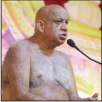
आगरा. शाबाश इंडिया

करते हुए कहा अपनी वाणी से जब जब स्वयं को गुणहीन, ज्ञानहीन की अनुभूति हो तो आराध्य मंत्र को पढ़ना, आराध्यगुरु का ध्यान करना अध्यात्म सबसे अच्छी दवा है हार्ट अटैक से बचने की, जिनको घबड़ाहट होती है, जिनका ब्रेन हेमरेज होता है, जिनका ब्लेड प्रेशर हाई होता है। यदि वो सही मन लगा करके अध्यात्म पढ़ ले तो घबड़ाहट नहीं हो सकती क्योंकि अध्यात्म हमें वो बिल पॉवर देता है, किससे घबड़ा रहा हूँ, कौन क्या मेरा बिगाड़ लेगा, मैं अविनाशी, शास्वत हूँ। ऐसी अनुभूति कभी आप करना अध्यात्म की बातों में पुण्य और पाप, शुभ-अशुभ कर्म में बहुत कुछ साहस आता है। इतना कष्ट होता है कि रोने का मन कर जाता है लेकिन आध्यात्म आते ही उन्ही कष्टों में चेहरे पर मुस्कान आ जाती है। कष्ट नहीं गया, कष्ट तो वो ही रहता है। वह जो