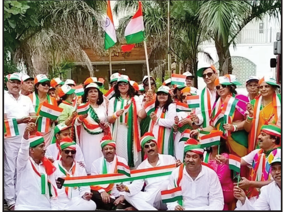
जयपुर/गोलाकोट. शाबाश इंडिया