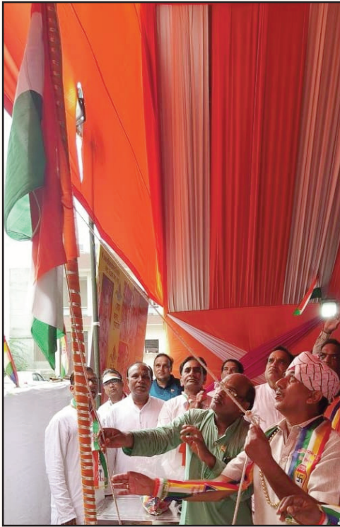
जयपुर. शाबाश इंडिया