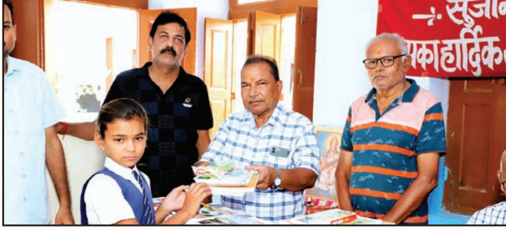
सुजाणगढ़. शाबाश इंडिया