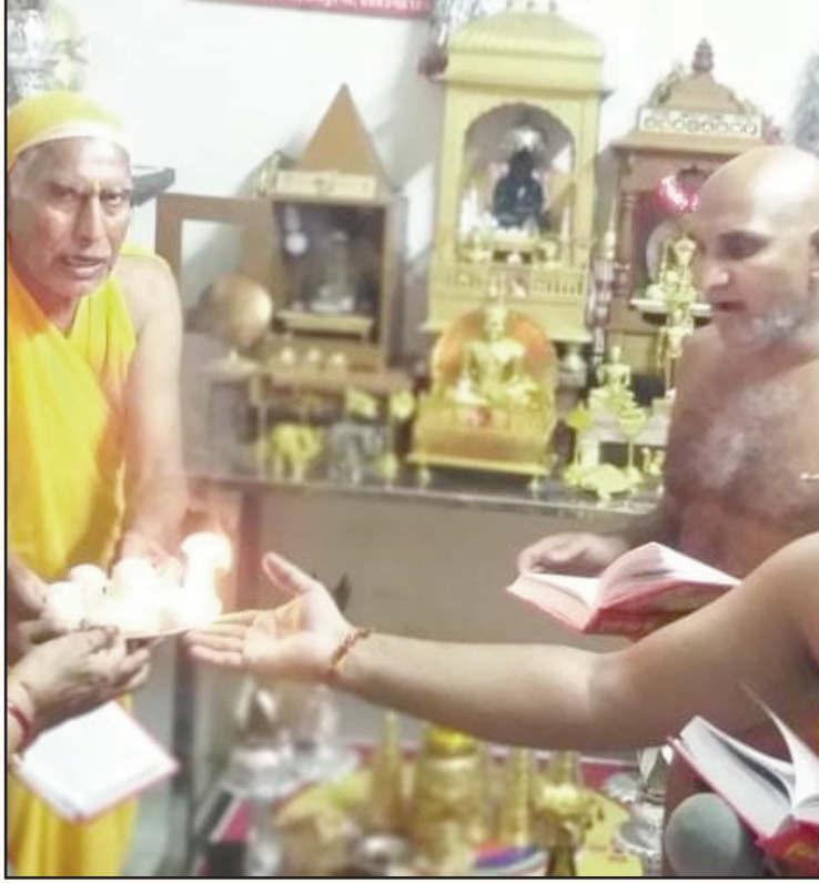
बगरू. शाबाश इंडिया