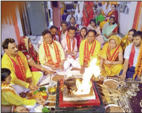
जयपुर. शाबाश इंडिया

श्री वेदमाता गायत्री वेदना निवारण केन्द्र की ओर से संचालित गृहे गृहे गायत्री यज्ञ श्रृंखला के अंतर्गत शनिवार को मानसरोवर के मान्यावास की शिव विहार कॉलोनी के शिव मंदिर के पास पंच कुंडीय गायत्री महायज्ञ का आयोजन किया गया। विश्व कल्याण और कॉलोनी वासियों के सुख, समृद्धि, निरोगी जीवन, उज्वल भविष्य और वातावरण के परिशोधन के उद्देश्य से आयोजित गायत्री महायज्ञ में बड़ी संख्या में श्रद्धालुओं ने आहुतियां अर्पित की। विनाशकारी तूफान बिफरजाँय से जान-माल की हानि न हो इसके लिए विशेष आहुतियां अर्पित की गई।