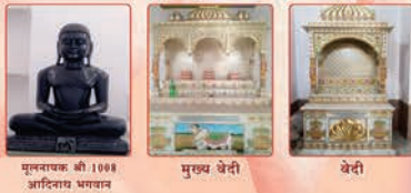
मुलनायक श्री 108 अदिनाथ भगवान