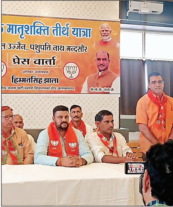
उदयपुर. शाबाश इंडिया