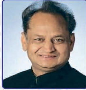
माननीय श्री अशोक गहलोत