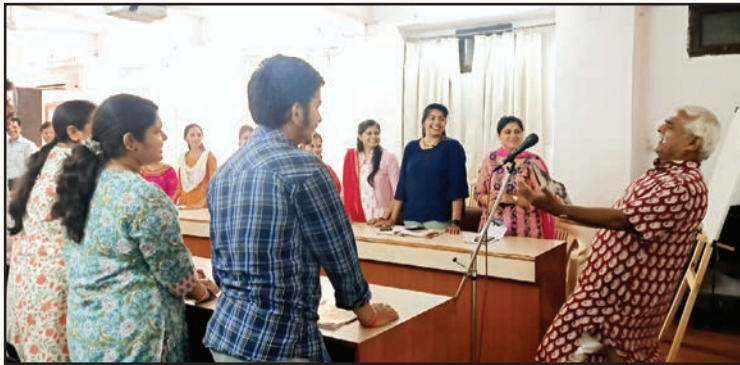
उदयपुर. शाबाश इंडिया