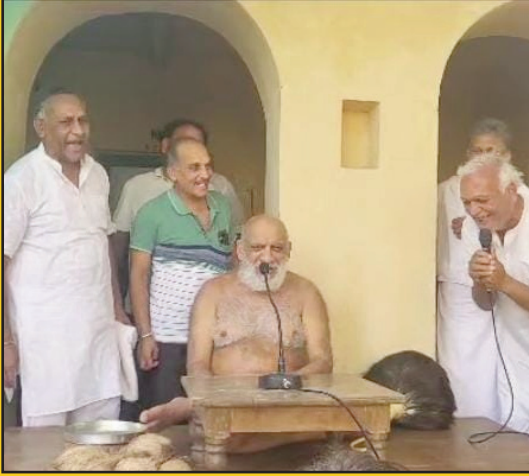
अशोक नगर, शाबाश इंडिया