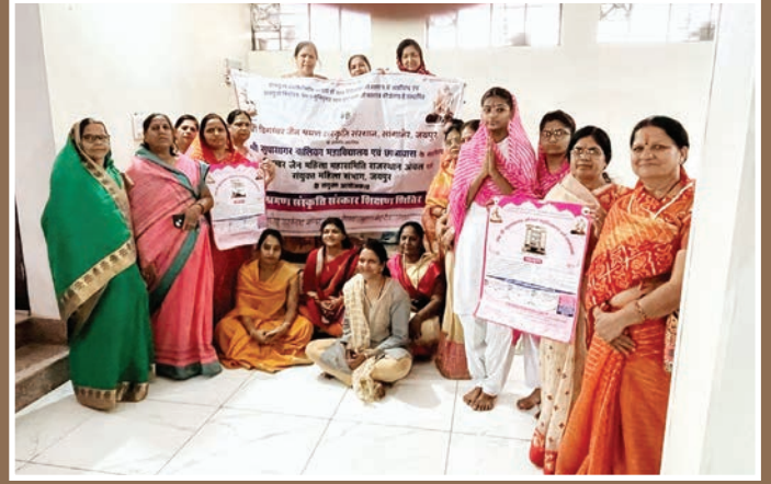
जयपुर. शाबाश इंडिया

आज 15 मई को श्री केसरिया पारसनाथ दिगंबर जैन मंदिर में धार्मिक शिविर का उद्घाटन किया गया। शिविर में बच्चों के लिए एवं बड़ों के लिए धार्मिक कक्षाएं लगाई जा रही हैं। शिविर में पढ़ाने के लिए श्रमण संस्कृति संस्थान सांगानेर से श्रमण संस्कृति संस्थान से विदुषी छात्रा आ रही है। शिविर में प्रतिदिन दीप प्रज्वलन, बच्चों को पुरस्कार वितरण एवं अल्पाहार वितरण किया जाएगा।