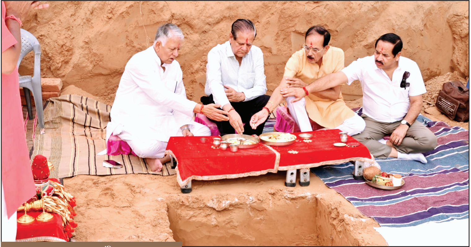
जयपुर. शाबाश इंडिया