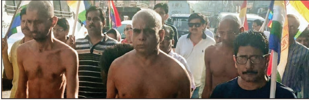
झुमरीतिलैया. शाबाश इंडिया

जैन धर्म के सबसे बड़े तपस्वी जिनकी चर्या तप और त्याग झलकता है ऐसे संत शिरोमणि आचार्य श्री 108 विद्यासागर जी महामुनिराज के परम प्रभावक शिष्य मुनि श्री 108 मुनि श्री 108 निर्वेग सागर जी महाराज, मुनिश्री 108 शीतलसागरजी महाराज ऐलक श्री 105 निजानंदसागरजी महाराज का भव्य मंगल प्रवेश आज दिनांक 20.4 को झुमरी तिलैया कोडरमा धर्म नगरी में हुआ। ज्ञात हो जैन मुनि इस भीषण गर्मी में जहां लोग धूप में निकलने को सोचते हैं वैसे समय में जैन मुनि खाली पैर पद गया नगरी से पद विहार करते हुवे राजगीर पावापुरी, नवादा होते हुए