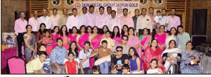
जयपुर. शाबाश इंडिया